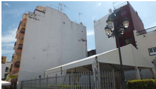
C/ El Lomo