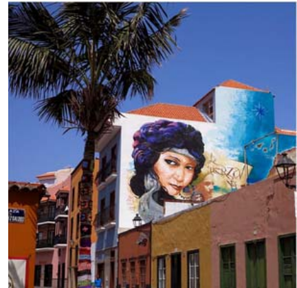
Artista: SEX el niño de las pinturas