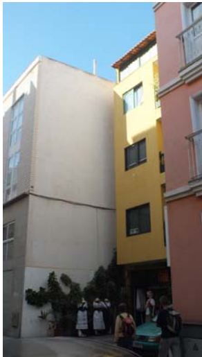
C/ Teobaldo Power