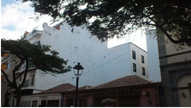
C/ Puerto Viejo

CONSORCIO rehabilitación PUERTO DE LA CRUZ