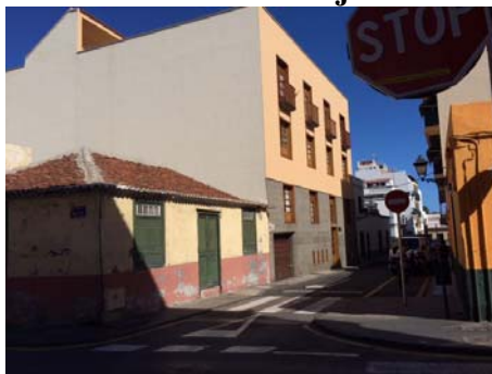
C/ Teobaldo Power