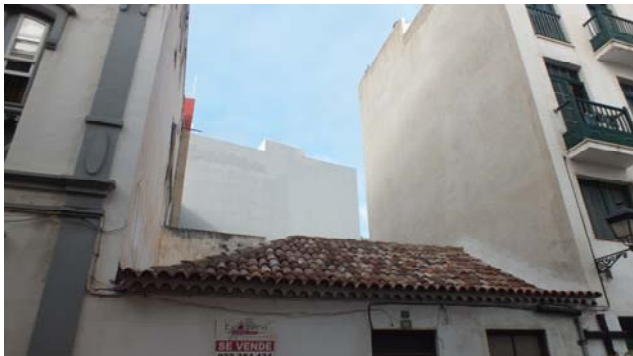
C/ Teobaldo Power