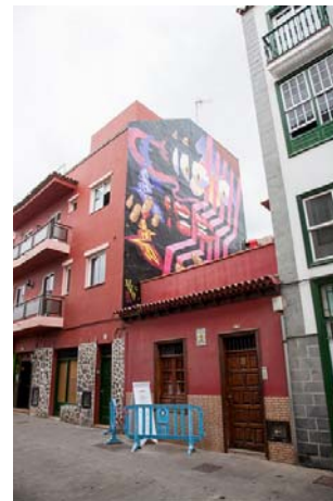
Artista: Iker Muro