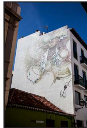
Artista: Feo Flip