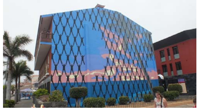
Artista: Victor Ash