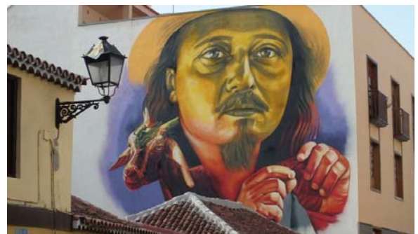
Artista: Sabotaje al Montaje