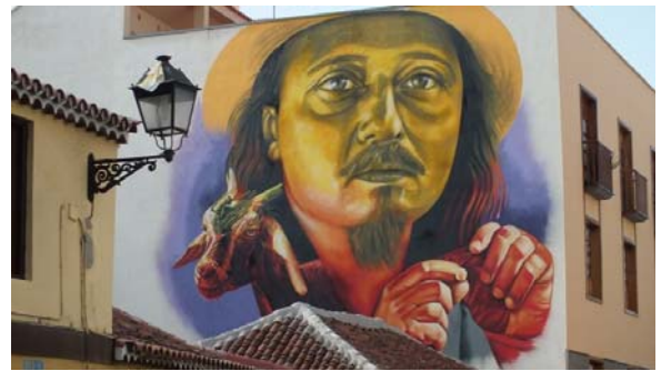
Artista: Sabotaje al Montaje