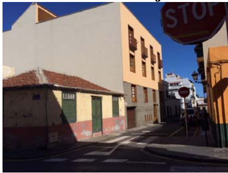
C/ Teobaldo Power