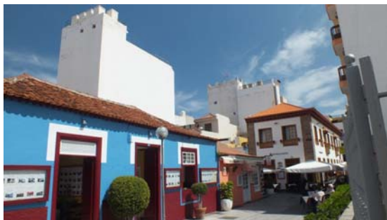
C/ Cruz Verde