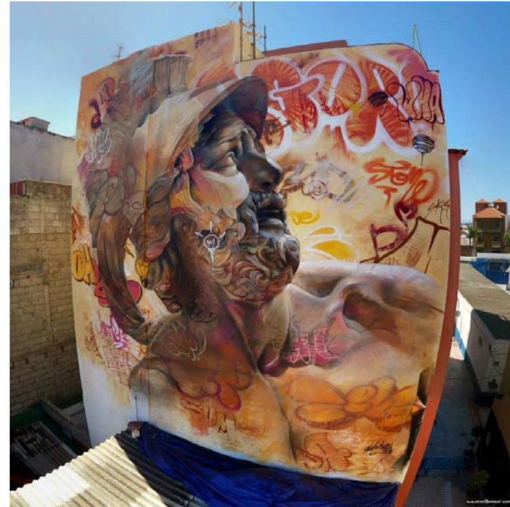
Artista: Pichi Avo