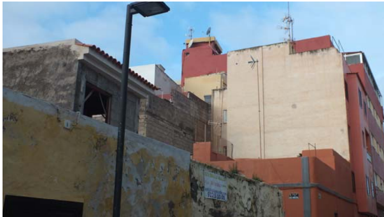
C/ José de Arroyo