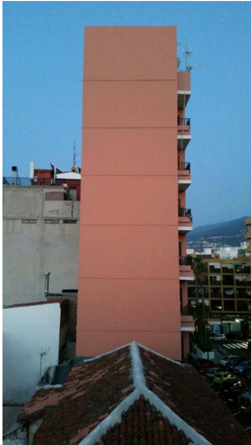
C/ José de Arroyo

CONSORCIO rehabilitación PUERTO DE LA CRUZ